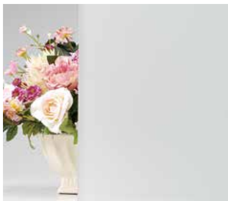
カラーラミペーン ホワイト