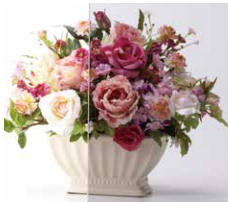
カラーラミペーン グレー