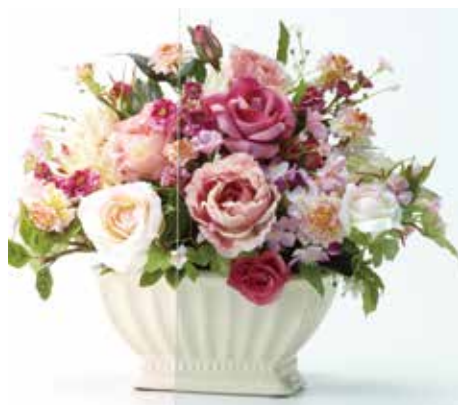
カラーラミペーン ライトブルーグリーン