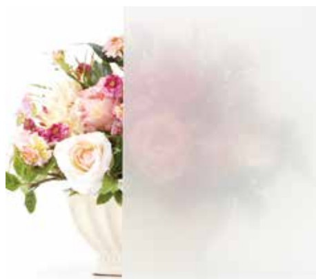
カラーラミペーン クールホワイト