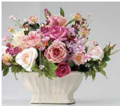
ラミペーン クリア