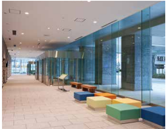
●千葉工業大学 津田沼キャンパス 1号館(千葉) 設計:横河建築設計事務所 施工:三井住友建設・五洋建設共同企業体

※開口部の設計にあたってはガラス建材総合カタログ「技術資料編」の8-3-5.改訂版 ガラスを用いた開口部の安全設計指針をご参照ください。