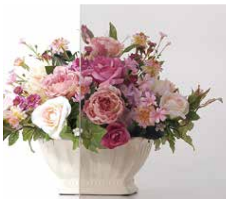
カラーラミペーン ブロンズ